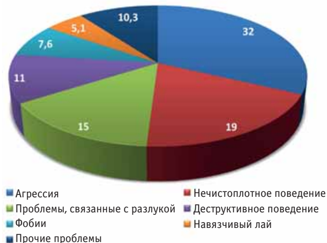
Рис. 2. Проявления девиантного поведения у собак, % (по данным специалистов по поведению животных) [8] Fig. 2. Manifestations of deviant behavior in dogs, % (according to the data of specialists in the behavior of the animals — Animal Behavior Consultant Newsletter) [8]

У собак наиболее распространенными проявлениями нежелательного поведения бывают агрессия, нечистоплотное поведение в доме и проблемы, вызванные разлукой (без уточнений) (рис. 2) [8].