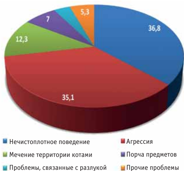
Рис. 1. Проявления девиантного поведения у кошек, % (по данным специалистов по поведению животных) [8] Fig. 1. Manifestations of deviant behavior in cats, % (according to the data of specialists in the behavior of the animals — Animal Behavior Consultant Newsletter) [8]

Основными проявлениями как агрессивного, так и тревожного типов девиантного поведения у кошек являются нечистоплотность в доме, агрессия по отношению к людям и к другим животным и мечение территории самцами (рис. 1). Установлено, что порода, возраст, пол и среда обитания кошки также могут влиять на возникновение конкретных проблем. Чаще других нежелательное поведение присуще персидским, сиамским, бирманским и им подобным породам. Персидские кошки отличаются большей склонностью к нечистоплотному поведению, порче мебели и вещей, хотя обладают спокойным, неагрессивным характером. Престарелые кошки обычно толерантны к незнакомым людям, но при этом менее терпимы к другим животным. Самцы чаще, чем самки, проявляют чрезмерную вокализацию, метят территорию мочой, но при этом редко проявляют агрессию по отношению к знакомым животным [8, 20, 38].